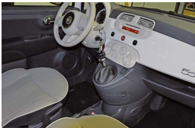
Il cruscotto della Fiat 500 è apparentemente intonso. Non c'è traccia del monitor per la scelta dei brani, del controller del volume, del ricevitore IR.