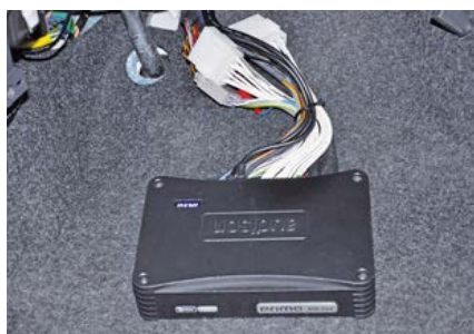
Il finale Audison Prima è installato sotto il cruscotto. Come si può vedere nella foto eseguita al termine dei cablaggi, oltre al collegamento digitale ottico è stato necessario anche quello con la sorgente per assicurare la riproduzione di radio e dispositivi connessi all'USB e all'ingresso Aux.

Ma non è ancora tutto. Rimane il problema di come selezionare i brani dal player Phonocar che, come già detto, non è altro che una black box nascosta nel cassetto portadocumenti. Lo si fa tramite il telecomando in dotazione al player, certo,