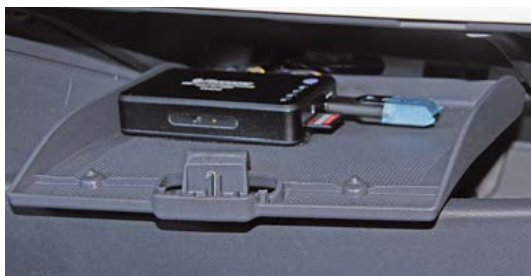
Il lettore multimediale Phonocar è installato nel cassetto portadocumenti, accessibile per la connessione delle memorie di massa previste.

Per il subwoofer è stata adottata una soluzione semplice ma efficace dal nome DBA 200.3, un incredibile gioiellino della Hertz con un altoparlante da 200 millimetri e due radiatori passivi racchiusi in un piccolo "cubotto" contenente anche un potente amplificatore monofonico.