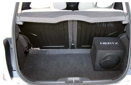
Il piccolo ma tellurico subwoofer Hertz DBA 200.3 installato in bagagliaio non occupa che una piccola porzione del volume a disposizione.