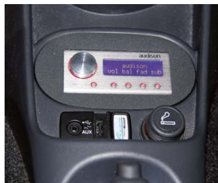
Il controller DRC del finale Audison, necessario per regolare il volume delle sorgenti digitali, è installato vicino alla leva del cambio, accanto agli ingressi Aux e USB.

L'uscita digitale dell'SFC e quella analogica della sorgente (connessione necessaria per ascoltare la radio FM e gli MP3 da USB e Bluetooth) sono state connesse ad un piccolo e potente amplificatore Audison Prima AP 8.9 bit, il vero e proprio cuore di questo impianto. Dotato di un DSP a 9 canali e di 8 canali di potenza, l'amplificatore Audison è stato chiamato a pilotare con due canali i tweeter in predisposizione sui montanti e con quattro canali, a ponte, i woofer da 16,5 centimetri in portiera. Anche gli altoparlanti impiegati sono della linea Prima. Un secondo sistema di altoparlanti Prima, pilotato dai rimanenti due canali del finale, è stato installato nei fianchetti posteriori.