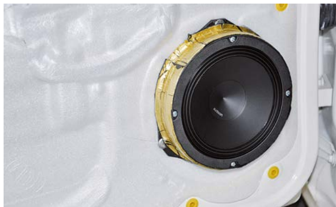
L'altoparlante in portiera installato a regola d'arte. La portiera ha subito un necessario e importante trattamento acustico.