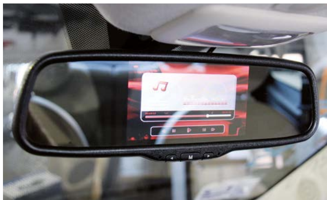
Il contenuto offerto dal lettore multimediale Phonocar può essere visualizzato sul monitor integrato nello specchietto. Anche in questo caso massima mimetizzazione.